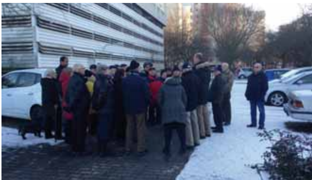
Wahlkreisabgeordneter Dietmann vor Ort im Gespräch mit den Mietern

Platz für alle Mieter der jetzigen Parkhäuser bieten. Danach erfolgt dann der Abriss des Parkhauses