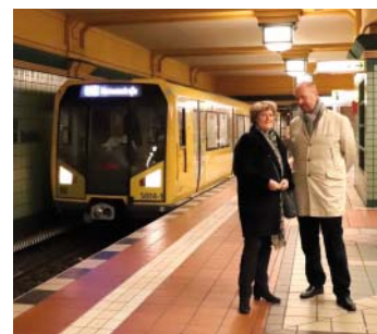
Besuch im Sommer 2020 im MV

Als direkt gewählte Abgeordnete Reinickendorfs werde ich mich darüber hinaus dafür engagieren, dass Reinickendorf von Förderprogrammen des Bundes für Stadtentwicklung und Daseinsvorsorge noch stärker profitiert als bisher.